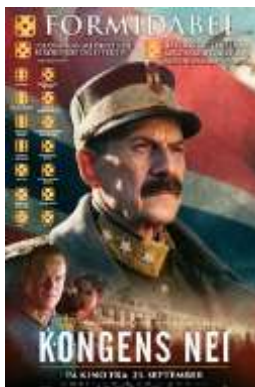
KLOKKEN 20.00 KONGENS NEI. Aldersgrense 9 år