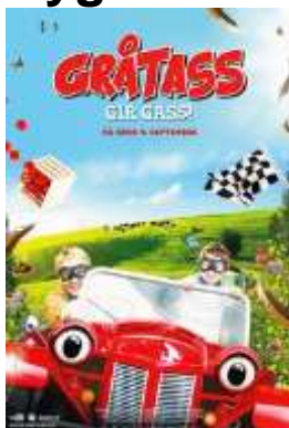
KLOKKEN 18.00. GRÁTASS GIR GASS