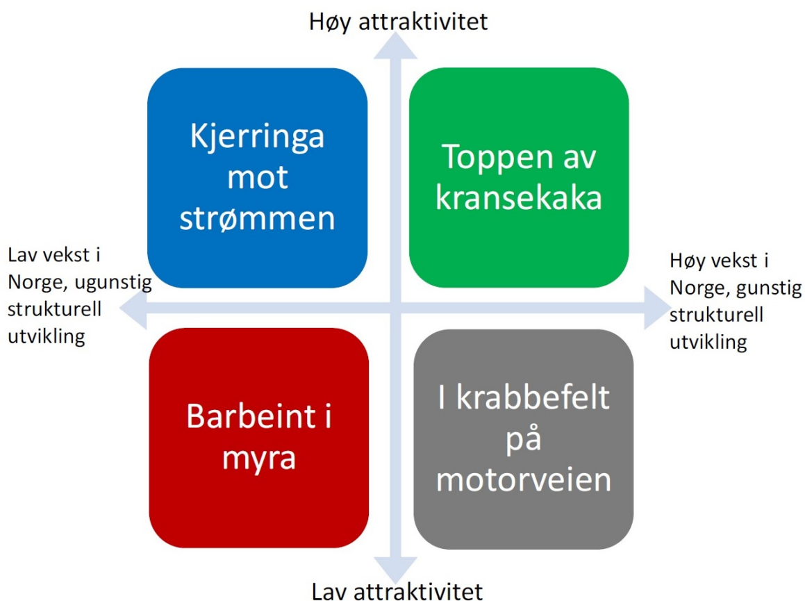
Scenarier for Østfold 2015-2030

Regionale planer som ikke rulleres i 2016 får forlenget sin virkeperiode fram til planlagt rullering i henhold til Regional planstrategi 2016-2019, eller til vedtak av neste regionale planstrategi.